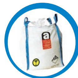
Déchets fibro-ciment (En déchèterie de Rosendaël uniquement, dans des sacs fermés fournis sur site, réservé aux particuliers)