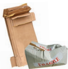
Tous les papiers et cartons