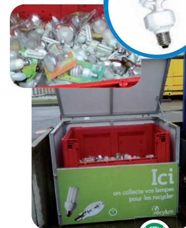
Récyllum (Seules les lampes ou ampoules portant ce picto se recyclent, uniquement sur les sites de Rosendaël et Petite-Synthe)