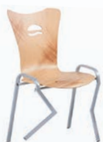
Ameublement domestique (rangement, table, sièges et literie)