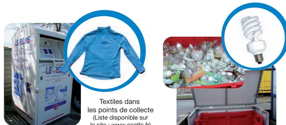
Textiles dans les points de collecte (Liste disponible sur le site : www.ecotlc.fr )