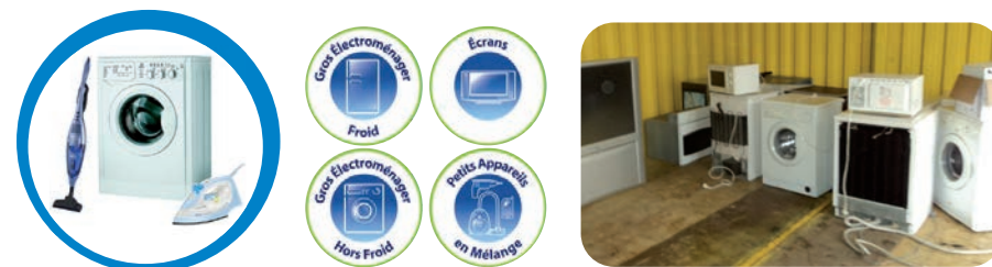
Électroménagers (Toutes les déchèteries sauf Gravelines)

Mais il est conseillé, pour ces produits, de les faire enlever ou de les déposer chez vos revendeurs d'électroménager.