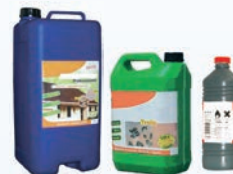
Solvants et colles