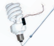
Ampoules économie d'énergie et tubes fluorescents